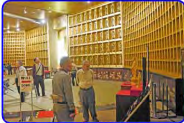
牛久大仏の内部は想像以上に広い